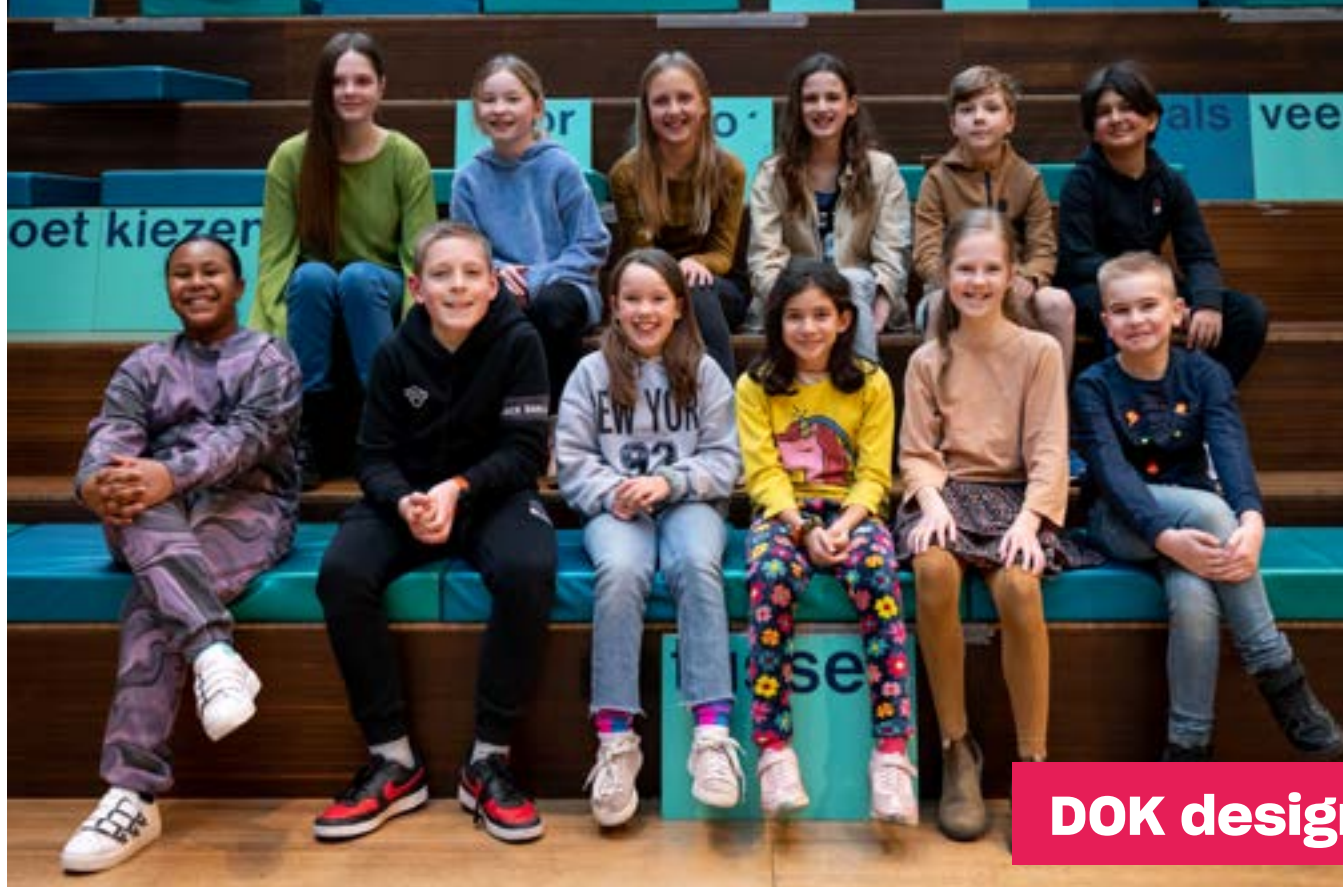
DOK designers 2023

In OPEN programmeren DOK en De VAK samen activiteiten. Wij bieden Delftse (en andere) organisaties in OPEN een (letterlijk) podium voor het geven van lezingen, debatten, presentaties en exposities. Vaak gekoppeld aan maatschappelijke of culturele thema's. Zoals geletterdheid, gezondheid, duurzaamheid en kunst en cultuur. We hebben samengewerkt met heel veel verschillende sociaal-maatschappelijke partners zoals het Alzheimercafé, het Architectencafé, het Energiecafé, de Energiecoach, de stichting Klimaatgesprekken, het Schrijfcafé, de Staat van Delft, Taalcafé Delft, O15 duurzaam, de Gemeente Delft en vele, vele anderen.